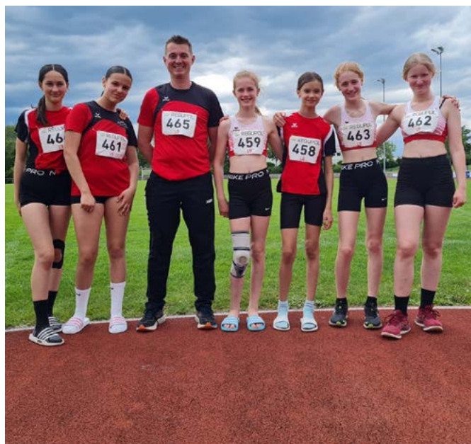
Die Aktiven in Euskirchen. Es fehlt Lotta Strepp.

Weitere Informationen zur Leichtathletik finden Sie auf www.tv-obermaubach.de